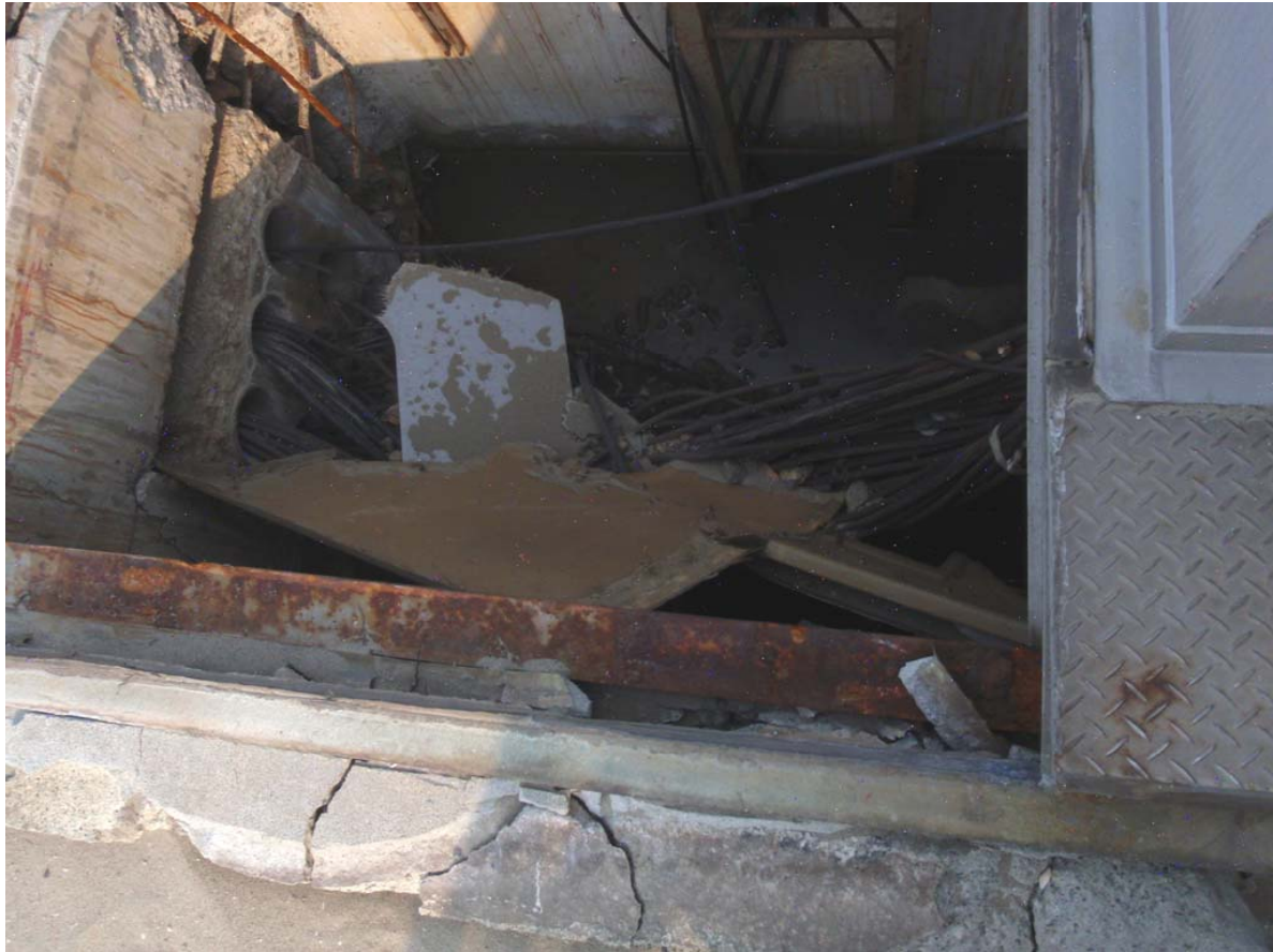
写真3 ピット内部の状況(1)