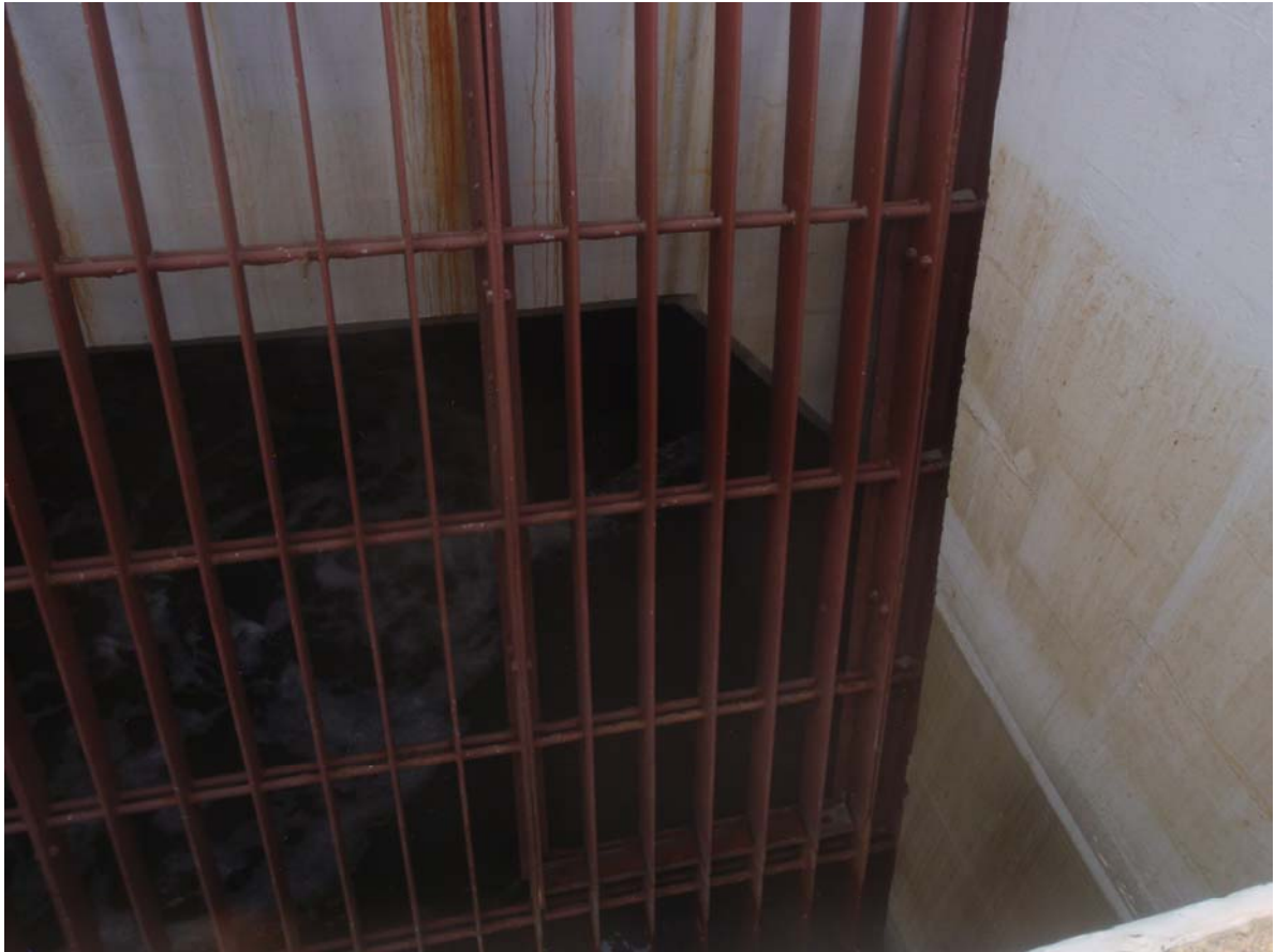
写真1 水漏れの状況(1)