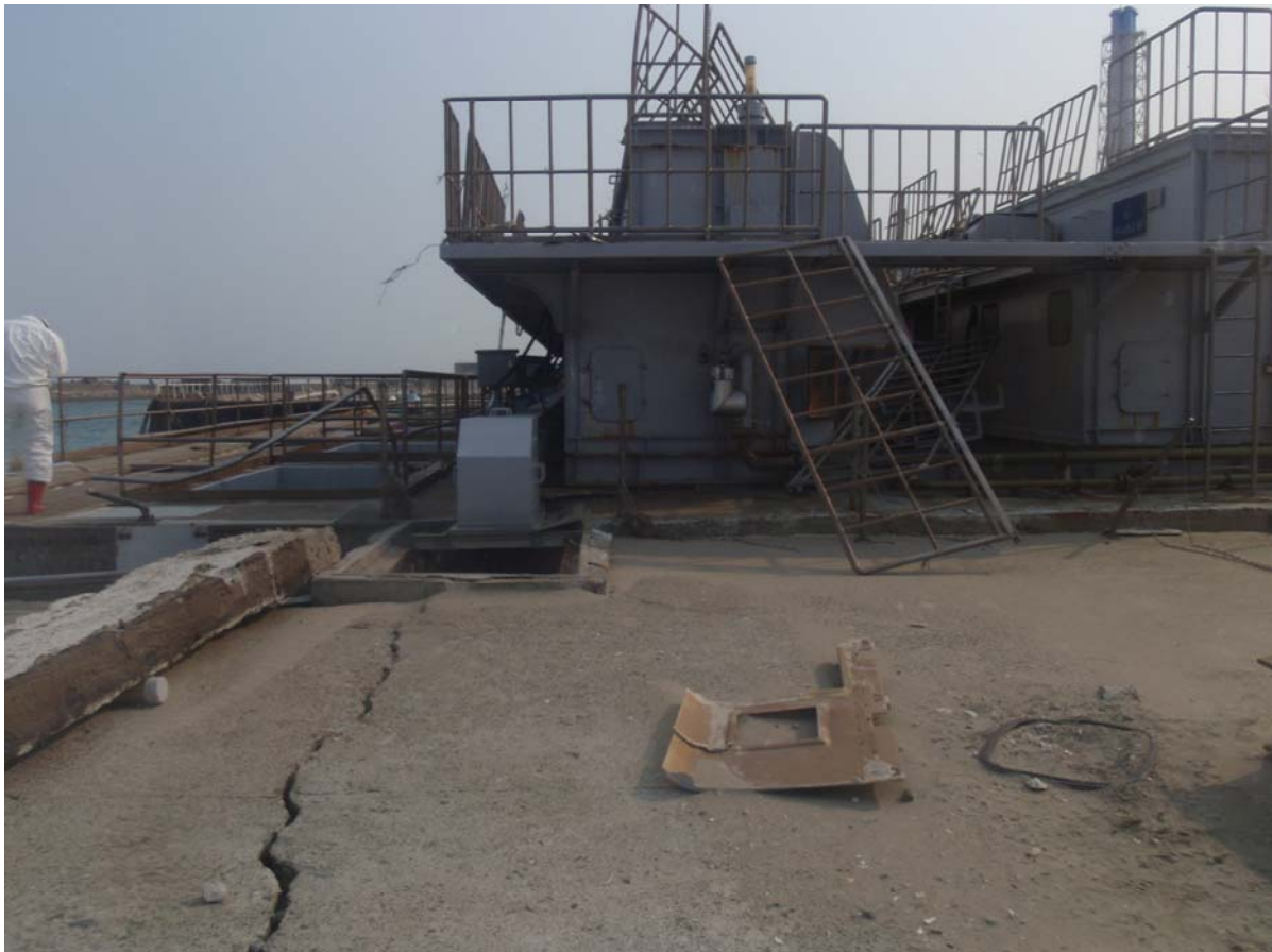
写真5 スクリーン設備本体(1)