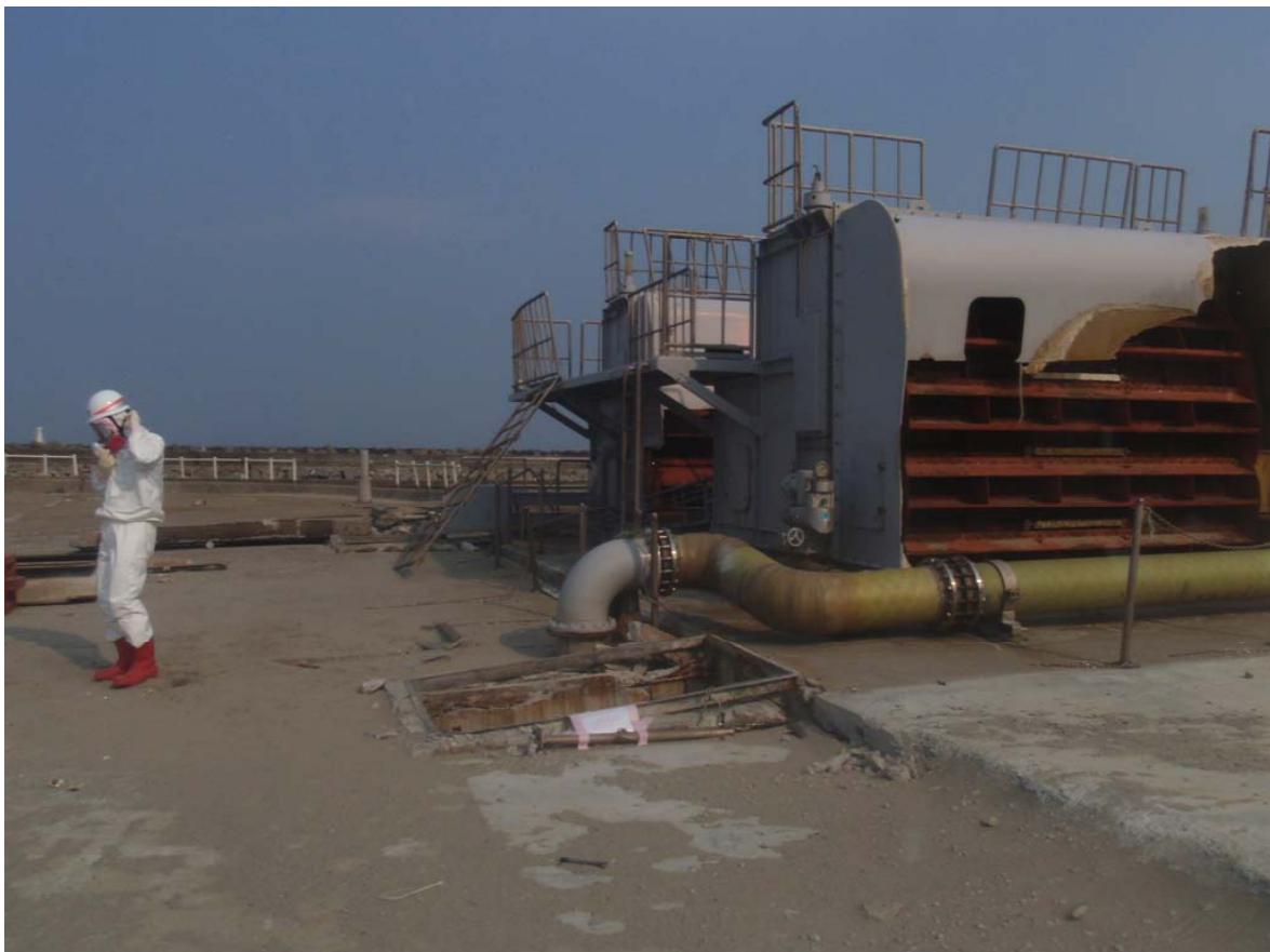
写真6 スクリーン設備本体(2)