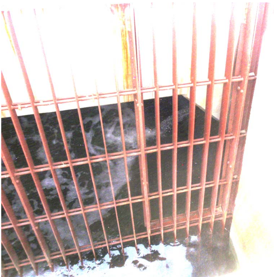
写真2 水漏れの状況(2)